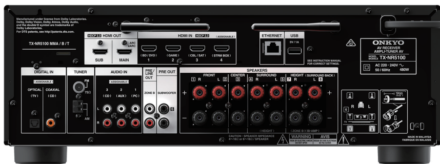
Tekst na odbiorniku może się różnić w zależności od regionu.