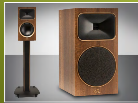
Martin Logan Foundation B2