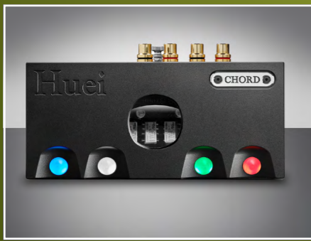
Chord Electronics Huei